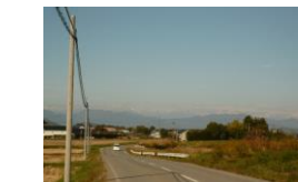
分譲地（写真右側）と県道 快晴時には北アルプスが見える。