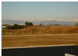
▲東より。B区画と北アルプス