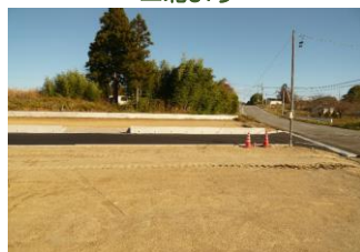
▲購入済の区画よりF区画と県道。