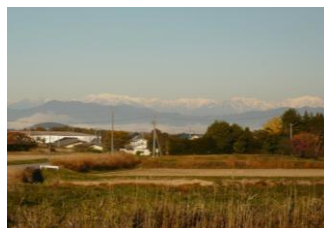
▲B区画から見る北アルプス