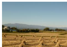
南側の田園風景と美ヶ原。