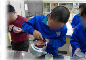
お茶をいれました