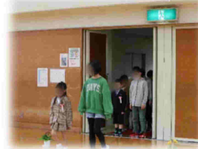
ご入学おめでとうございます