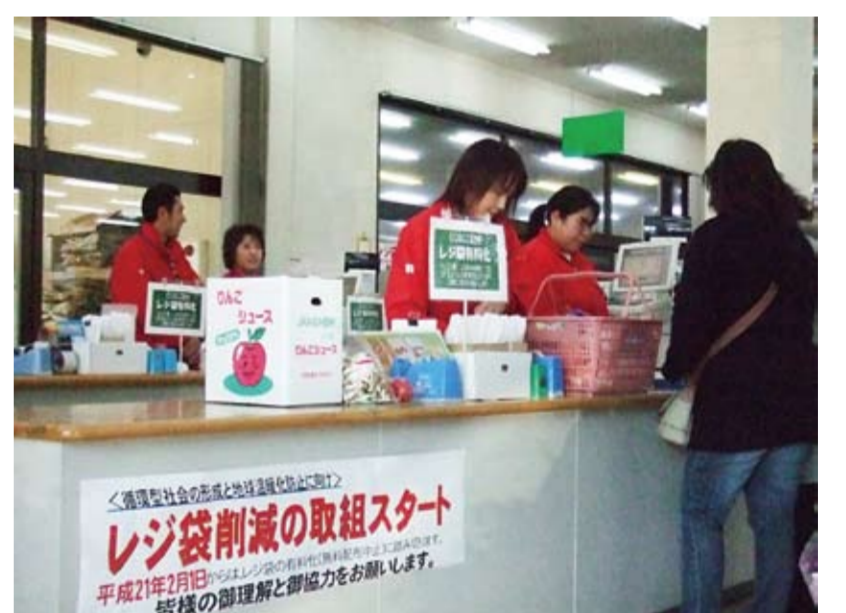
登録店が足並みをそろえてレジ袋を有料化