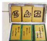
◀優秀賞 エコかるた