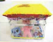
優秀賞▶ え・ん・と (ペットボトルのリ サイクルチェア)