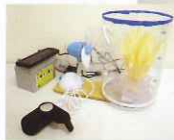
◀優秀賞 ソーラー加湿器

このほかにも、地球温暖化を防ぐための取り組みがたくさんあります。このような取り組みに役立つエコグッズを考えてみてください。